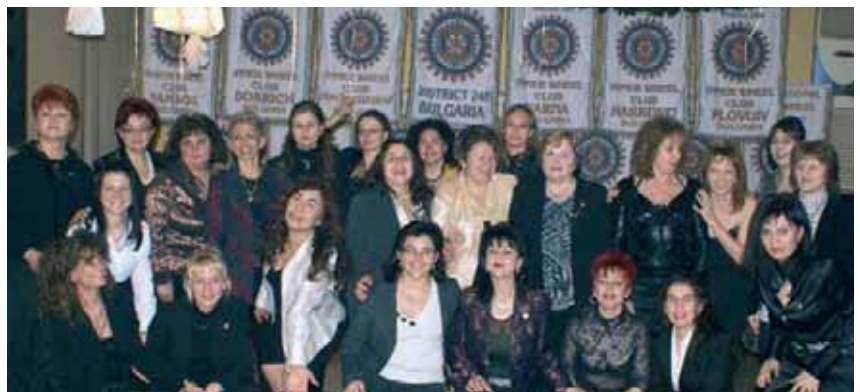
Обща снимка на представителите на клубовете на празника в Плевен