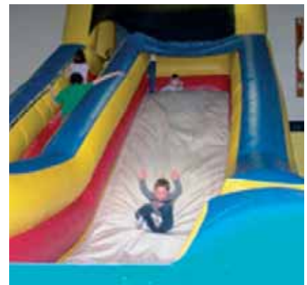
Седмицата на семейството в Ротари клуб Гаретсвил – Хирам предложи на децата различни забавления