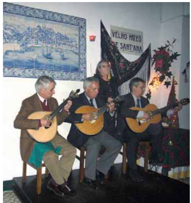
Недопустимо е да отидеш в Лисабон и да не се насладиш на традиционната, едновременно лирична и страстна, португалска музика - фадо

Приятели, споделете с ротарианците от вашите клубове и дистрикти същността на този стратегически план на РИ, защото Ротари не престава да СПОДЕЛЯ!