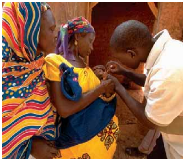
5 декември 2003 г., Маради, Нигер Национални имунизационни дни в селцето Гарин Маджини