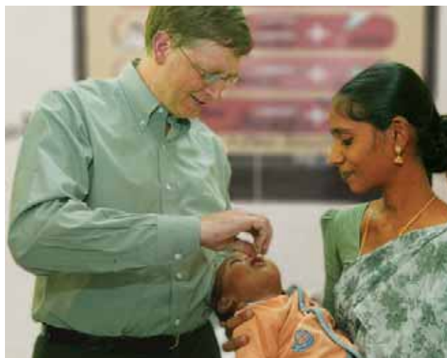
Бил Гейтс ваксинара дете в Индия през 2002 г.

Призовавам ви да прочетете повече за дарението от Фондация „Гейтс“, както и за гранта от 5.5 милиона долара от Google.org, и да помислите с какво вие бихте могли да се включите в тази мащабна кампания за свят без полиомиелит.