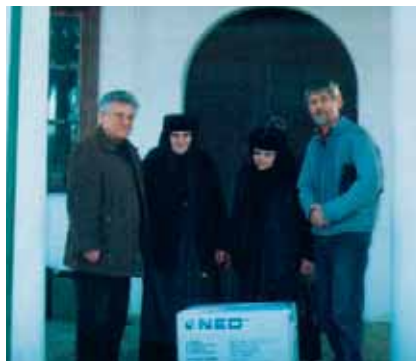
Монахините приемат подаръка

Друга изява беше спонсорирано издаването на стихосбирка на известния поет на грами в стихове Радко Радков, два пъти кавалер на френската култура. Средствата за знамената на входа на града също са дарение от клуба.