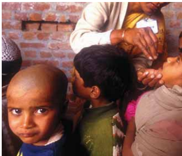
8 март 2002 г., Утар Прадеш, Индия. Имунизация против детски паралич в Морадабад. През 2002 г. в Морадабад имаше най-голям проблем с детския паралич от всички индийски области. Но от септември 2006 г. не е известен нито един на заразяване с тип 1.

Понякога предизвикателствата са лични. Джени Хортън, представител на Световната здравна организация и консултант в Пакистан, споделя, че още ѝ е трудно да приеме, когато някой от резултатите на изследваните пациенти потвърди полио от I тип. Днес има надежда, че борбата ще завърши успешно с обединените усилия на партньорите по програмата: Ротари Интернешънъл, Световната здравна организация, Американския център за предотвратяване и борба с бедствията и УНИЦЕФ. Нови проекти се движат в останалите ендемични страни – Афганистан, Индия, Нигерия и Пакистан. Нови методи за диагностика потвърждават болестта за два пъти по-кратко време, а оралната ваксина атакува на 100 % най-опасния вирус полио от I тип. Статистиката е обнадеждаваща: заразените с вируса на полиомиелита са намалели с 80 % от началото на 2007 г. От старта на кампанията през 1985 г. до днес ротарианците са дали за каузата повече от 630 милиона щ.д. Ваксинирани са повече от 2 милиарда деца в 122 държави. През 80-те години с вируса са се заразявали средно по хиляда деца на ден. Днес толкова се заразяват годишно. Но ако светът се откаже да продължи тази кампания, 10 милиона деца ще се парализират през следващите 40 години. Ротарианците и техните партньори са длъжни да доведат делото до край.