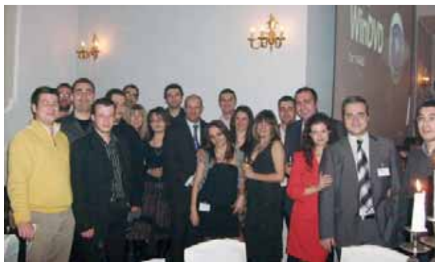
Част от участниците в срещата

Ние успяхме да усетим ритъма на Солун, да посетим храмовете «Св. Димитър», «Св. София», Ро-