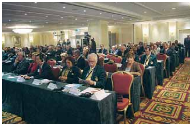
Част от участниците в Ротари Института

то, на което желаят. Трябва да разширим съвместните си действия и да използваме специалисти, които да ни помогнат да попълним образа на Ротари в общественото съзнание.